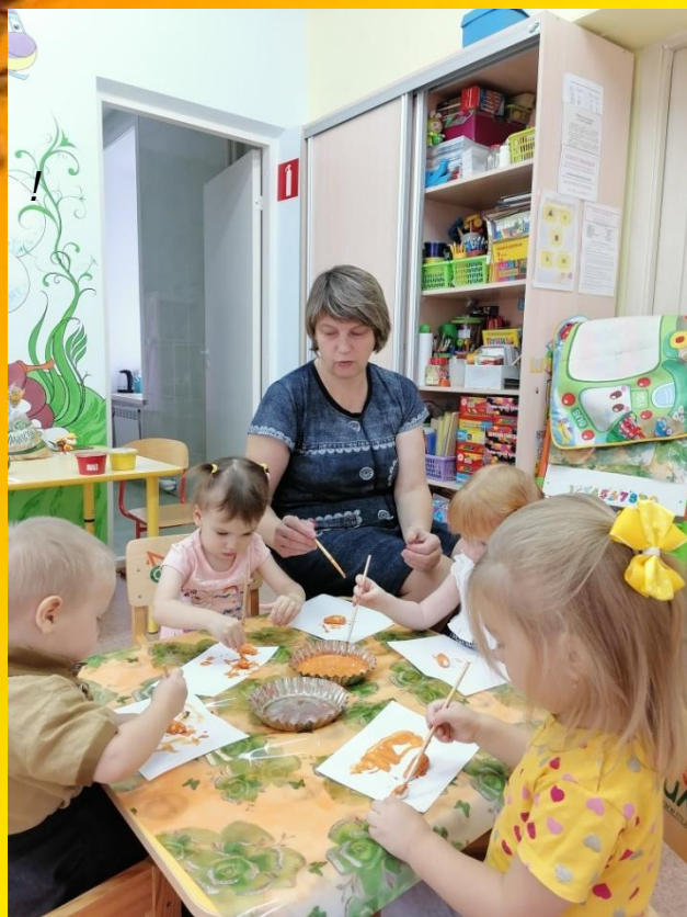
«Пирожки для бабушки»