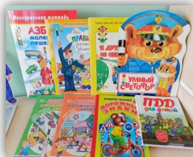
Подборка детских книг по ПДД